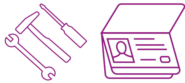
Mensenhandel en -smokkel