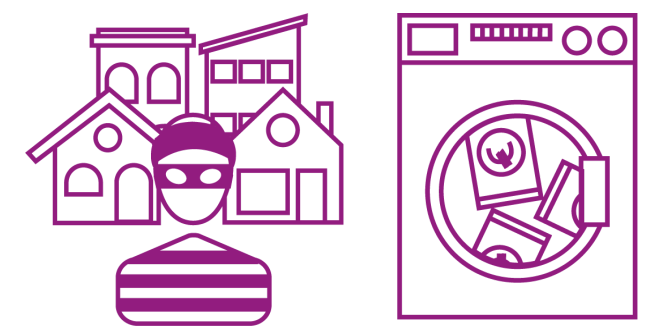
(Vastgoed)fraude en witwassen

Een winkel waar je niet kunt pinnen, nooit klanten ziet en de eigenaar een dure auto rijdt